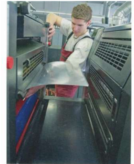
Klaarmaken voor offsetdruk

Een vergelijk, de jaren 1930 bij de Duitse Reichpost en drukken in de XXI ste eeuw (Zwitserland).