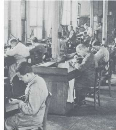
Graveerders aan het werk bij de Duitse Reichpost in de jaren 1930.

Twee proeven van de moederplaat zonder waarde aanduiding. Van het basis werk zal men secundaire platen maken waar dan de waarde zal ingegraveerd worden.