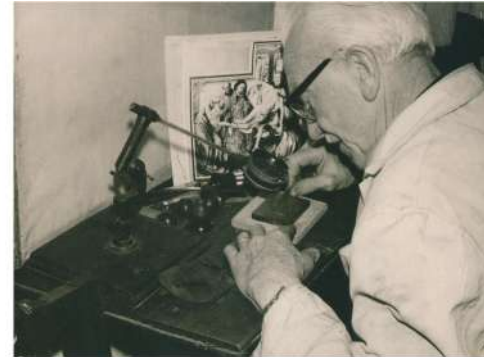
Meester-graveerder aan het werk.

We zullen even verder gaan op het artikel over staaldiepdruk. Actueel wordt soms een diamant of laser gebruikt om te graveren, maar men bekommt nooit hetzelfde resultaat. Er is ook rasterdiepdruk, maar dat is chemisch.