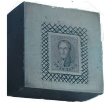
Afgewerkte moederplaat - beeld in negatief