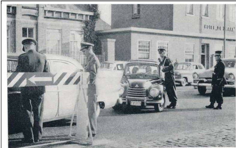
Tijdwinst aan de grens: Belgische en Nederlandse douaniers werken samen. Ook onze gendarmerie en marechaussee is er bij.

Wie herinnert zich nog de uren aan de grens? Is dat de toekomst dat ze ons bieden? Met nog eens een bezoek aan het wisselkantoor. Toen waren er niet zo veel auto's, nu 3 min per auto. Je verlof aan de grens doorbrengen?