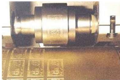
Overdracht met mollet op de drukrol.

Met de verharde moederplaat wordt een mollet gemaakt. Na verharding dient deze om secundaire moederplaten te maken en om de drukplaat te realiseren.